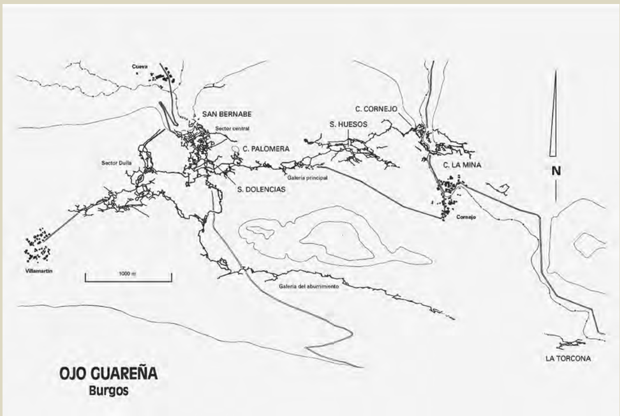
OJO GUAREÑA Burgos