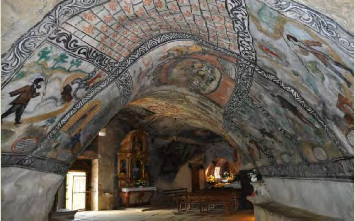
Hermitage of San Bernabe, Caves de Ojo Guareña