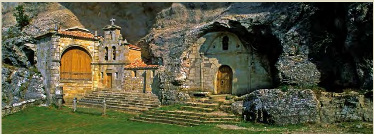
Hermitage of San Bernabe, Caves de Ojo Guareña

*Nécessaire. Éclairage, casque, combinaison, chaussures pour grotte.